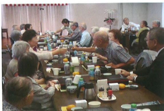
敬老祝賀会の様子(食堂にて)